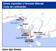
Anse des Dunes

Zones de contraintes relatives à l'érosion du littoral de Rivière et du golfe du Saint-Laurent Zones soumises de façon temporaire ou permanente à des contraintes relatives à l'érosion du littoral de Rivière et du golfe du Saint-Laurent. — Ligne de site